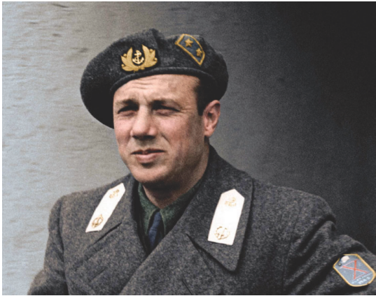
"Kara Prens" lakaplı Valerio Borghese

burjuva propagandaya rağmen, Alman ve İtalyan faşizminin eli kanlı kadroları ABD güçleri tarafından partizanların ya da savaş sonrası kurulan mahkemelerin elinden kurtarılıyor, savaş boyunca Sovyetler Birliği'ne ve partizanlara karşı edindikleri tecrübeden faydalanılmak üzere devşiriliyorlardı. Bu süreçte devşirilen en azılı faşistlerden biri "Kara Prens" lakaplı Vale-